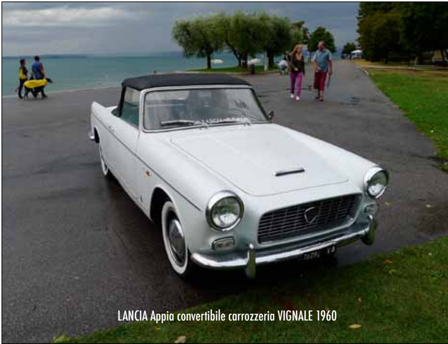
LANCIA Appia convertibile carrozzeria VIGNALE 1960