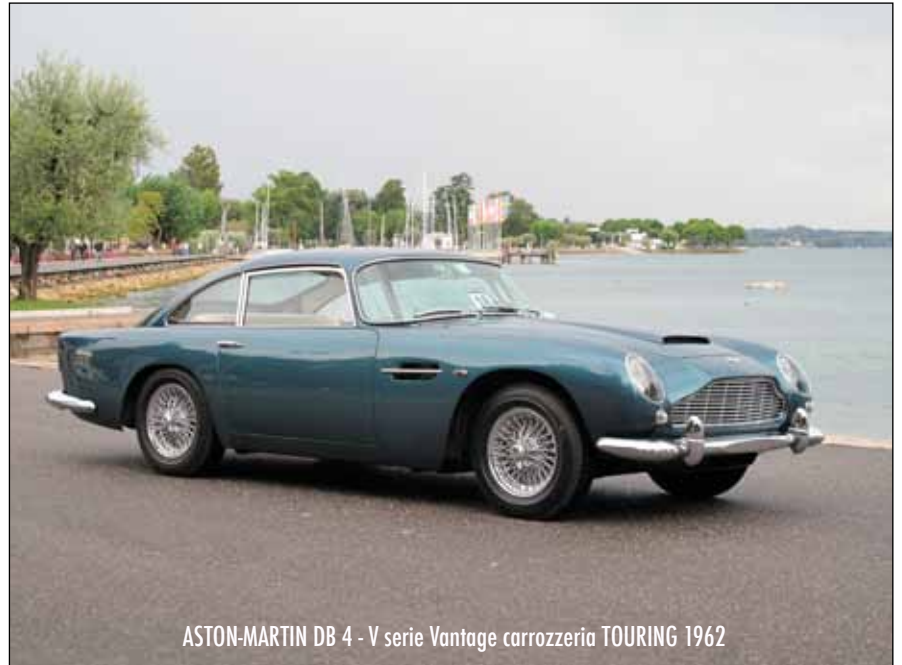
ASTON-MARTIN DB 4 - V serie Vantage carrozzeria TOURING 1962