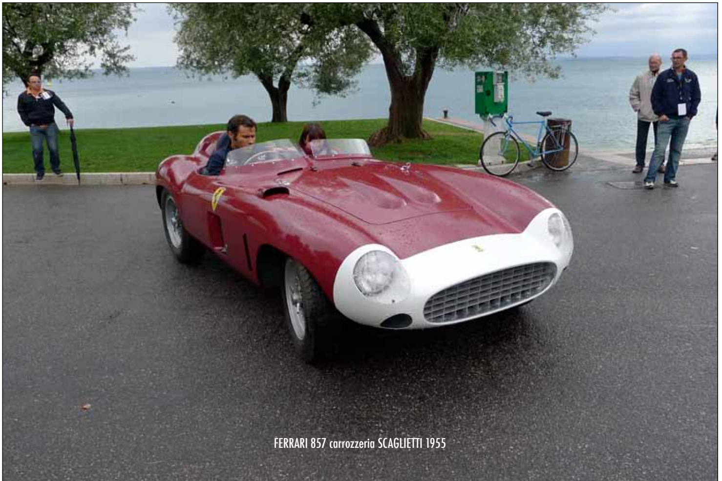
FERRARI 857 carrozzeria SCAGLIETTI 1955