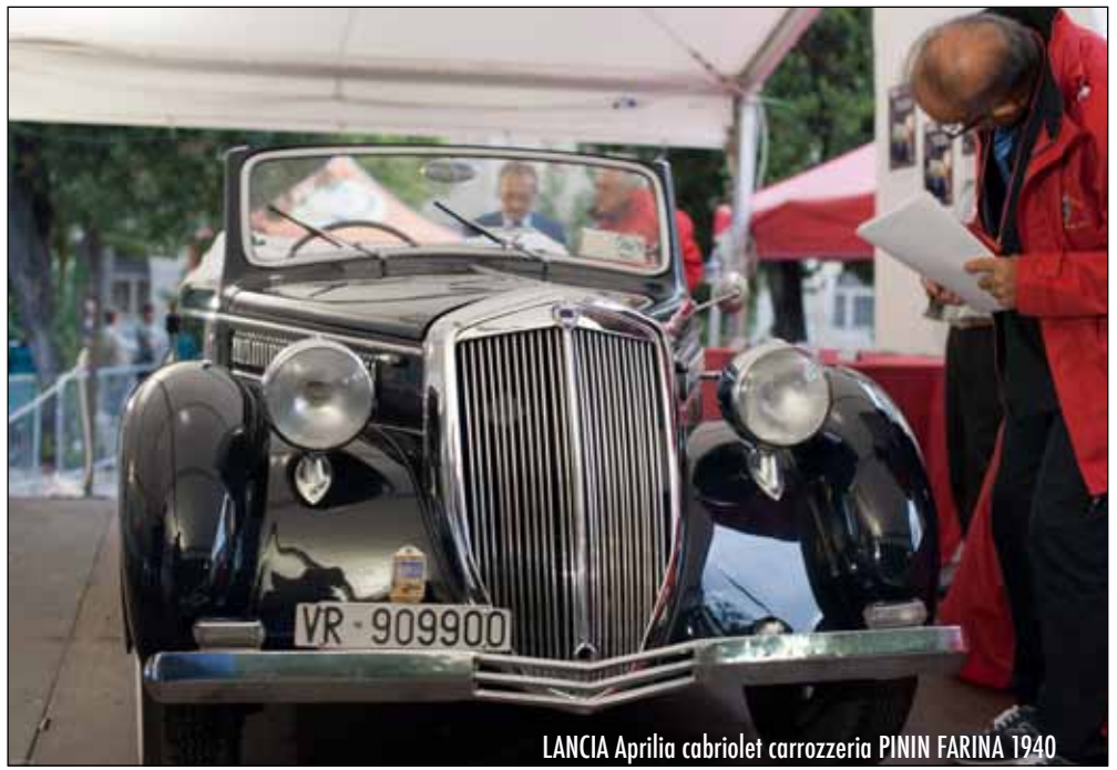
LANCIA Aprilia cabriolet carrozzeria PININ FARINA 1940