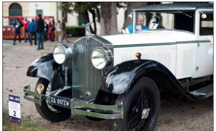
Le vetture esposte nel Parco Carrara Bottagisio