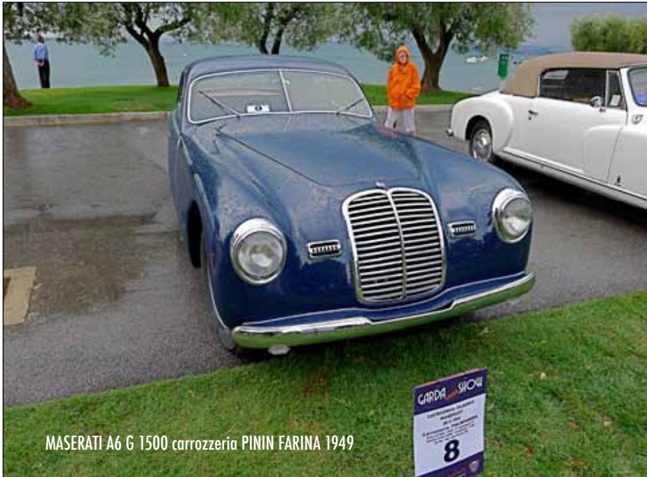
MASERATI A6 G 1500 carrozzeria PININ FARINA 1949