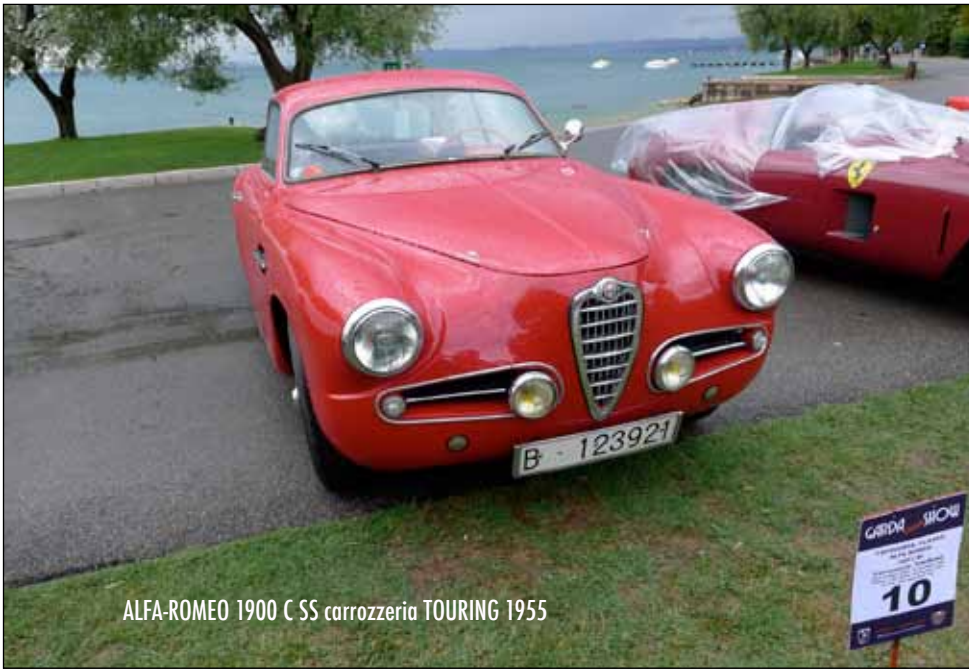
ALFA-ROMEO 1900 C SS carrozzeria TOURING 1955