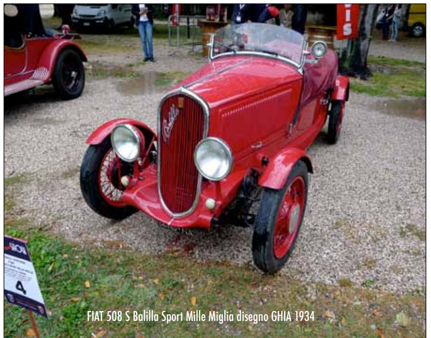
FIAT 508 S Balilla Sport Mille Miglia disegno GHIA 1934