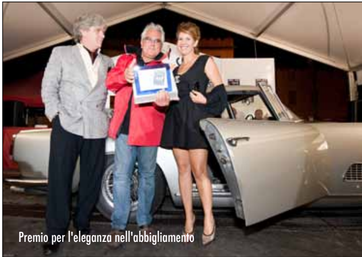
Premio per l'eleganza nell'abbigliamento