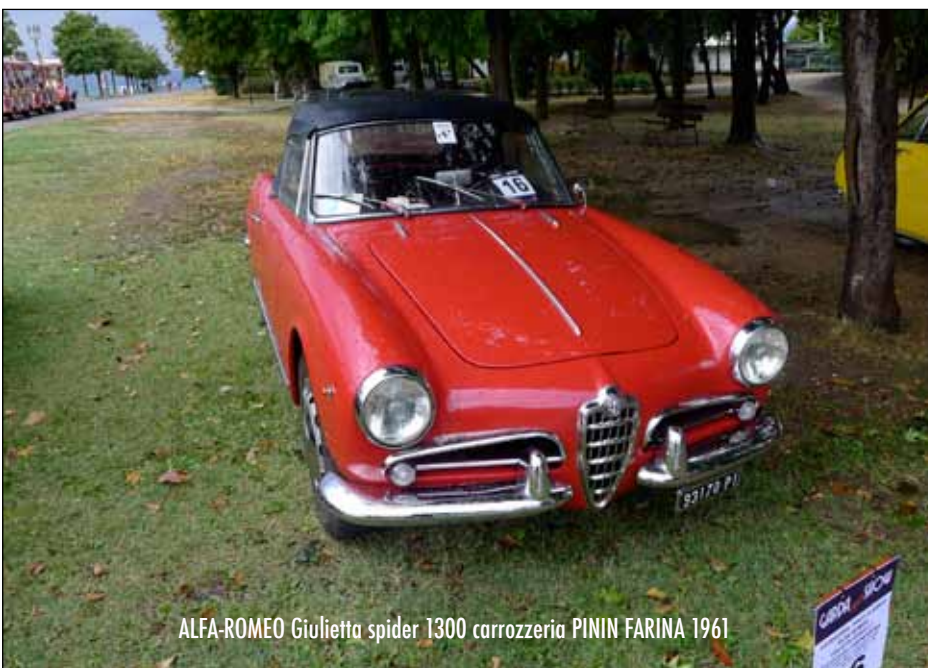
ALFA-ROMEO Giulietta spider 1300 carrozzeria PININ FARINA 1961