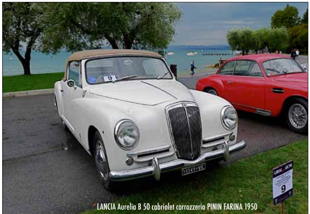
LANCIA Aurelia B 50 cabriolet carrozzeria PININ FARINA 1950