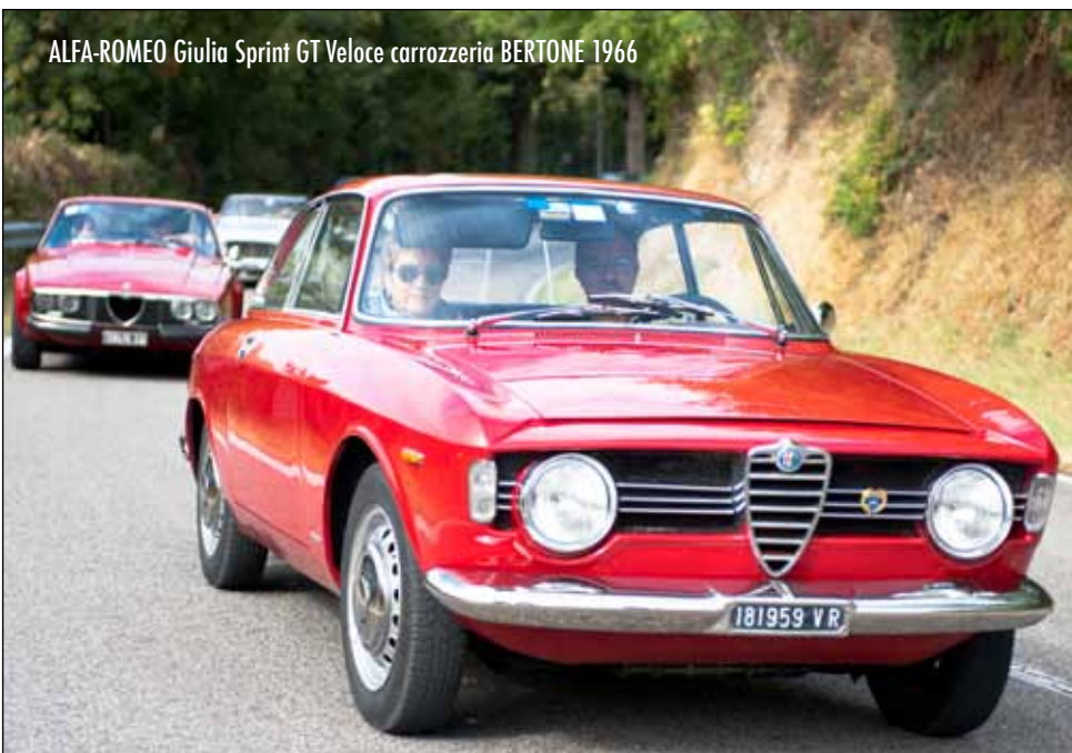
ALFA-ROMEO Giulia Sprint GT Veloce carrozzeria BERTONE 1966