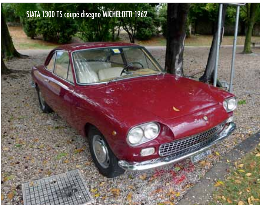
SIATA 1300 TS coupé disegno MICHELOTTI 1962