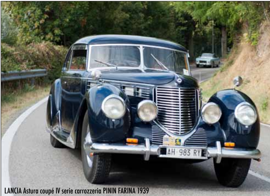
LANCIA Astura coupé IV serie carrozzeria PININ FARINA 1939