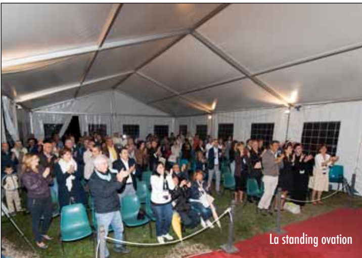
La standing ovation