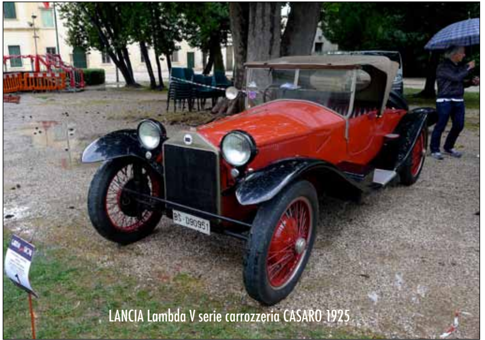
LANCIA Lambda V serie carrozzeria CASARO 1925