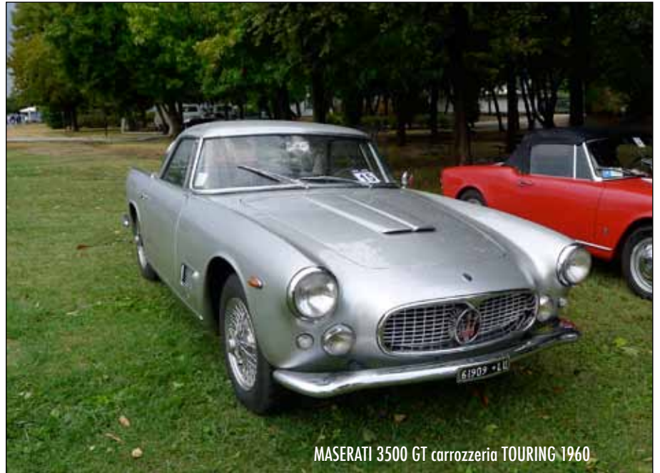
MASERATI 3500 GT carrozzeria TOURING 1960