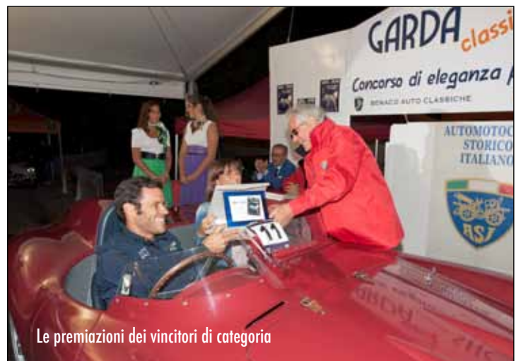
Le premiazioni dei vincitori di categoria