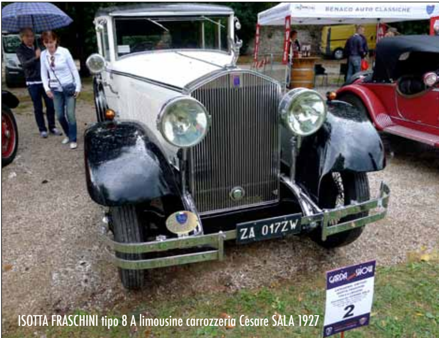
ISOTTA FRASCHINI tipo 8 A limousine carrozzeria Cesare SALA 1927