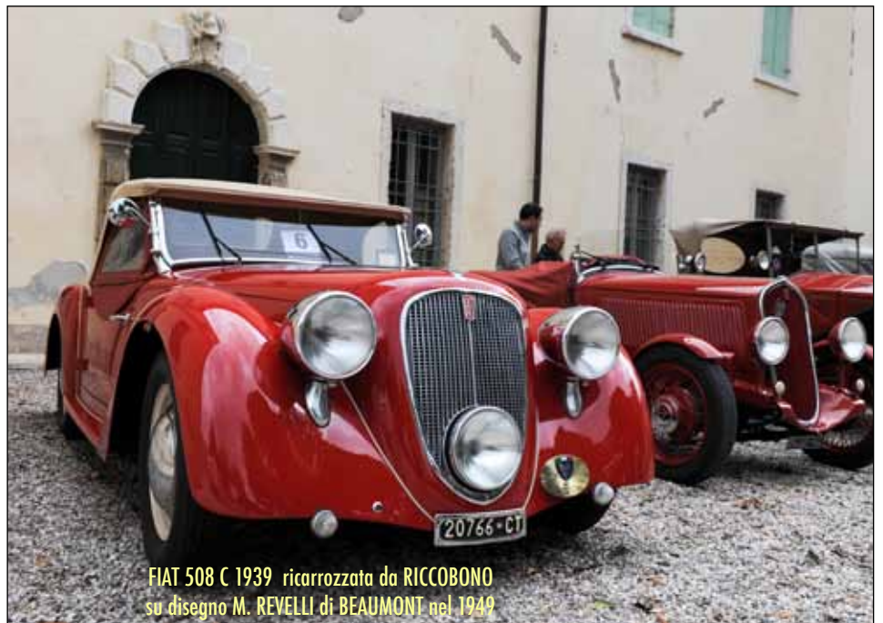
FIAT 508 C 1939 ricarozzata da RICCOBONO su disegno M. REVELLI di BEAUMONT nel 1949