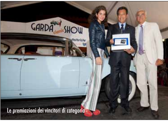
Le premiazioni dei vincitori di categoria