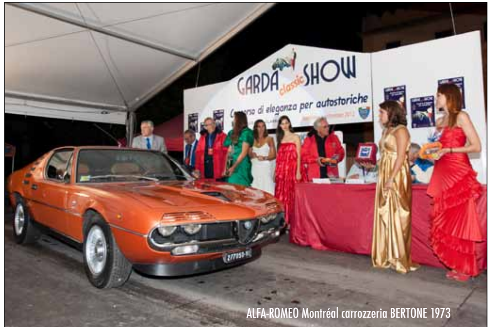
ALFA-ROMEO Montréal carrozzeria BERTONE 1973