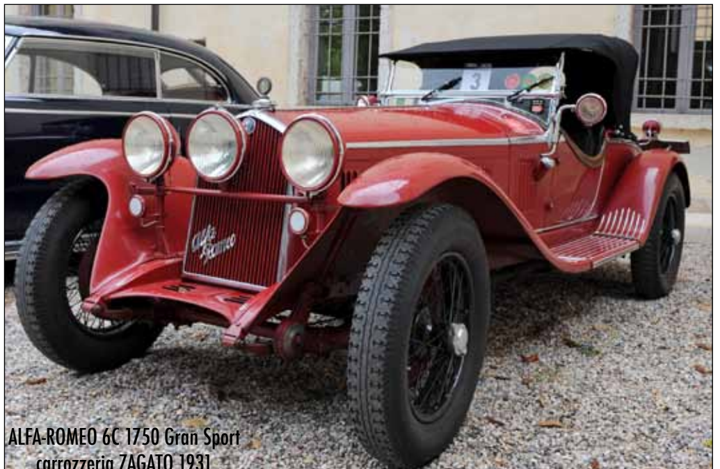
ALFA-ROMEO 6C 1750 Gran Sport carrozzeria ZAGATO 1931