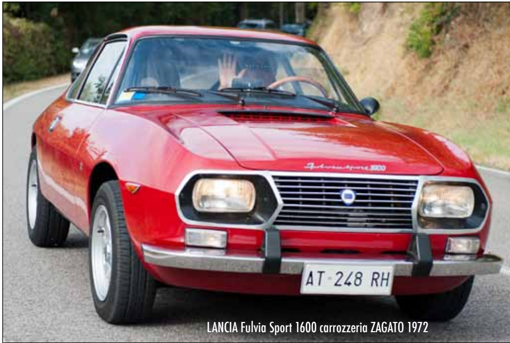
LANCIA Fulvia Sport 1600 carrozzeria ZAGATO 1972