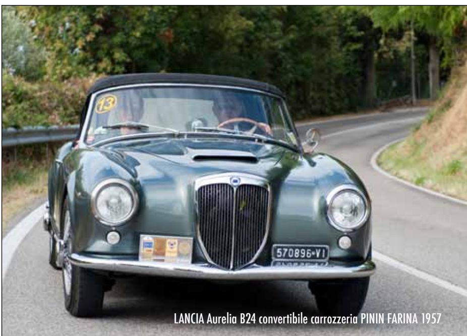
LANCIA Aurelia B24 convertibile carrozzeria PININ FARINA 1957