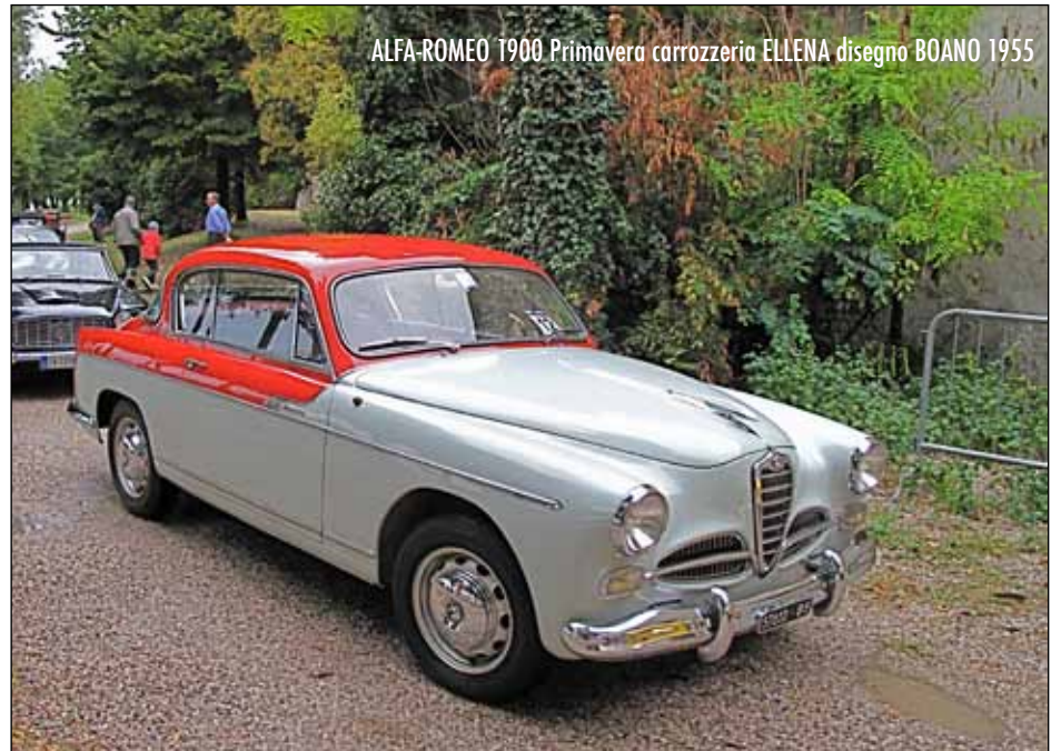
ALFA-ROMEO 1900 Primavera carrozzeria ELLENA disegno BOANO 1955