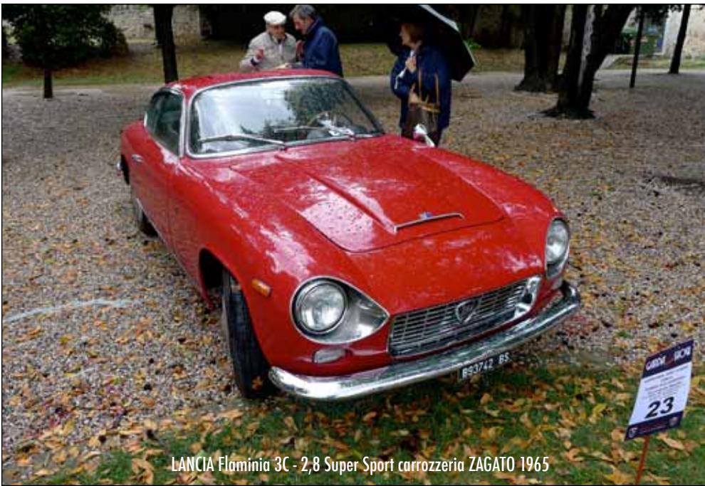
LANCIA Flaminia 3C - 2,8 Super Sport carrozzeria ZAGATO 1965