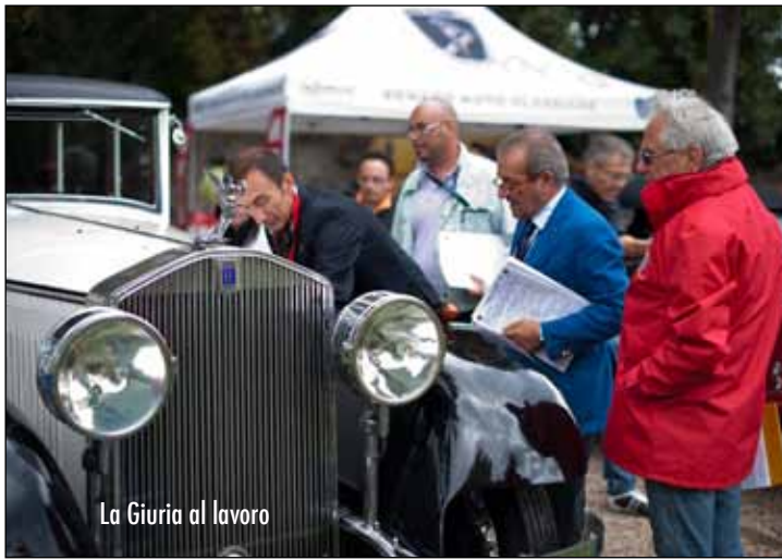
La Giuria al lavoro