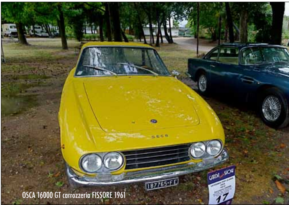
OSCA 16000 GT carrozzeria FISSORE 1961