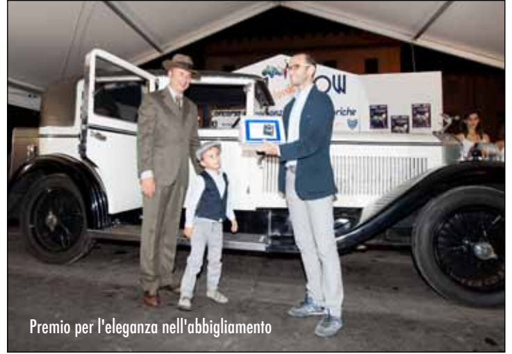
Premio per l'eleganza nell'abbigliamento